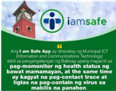
I am safe QR Code