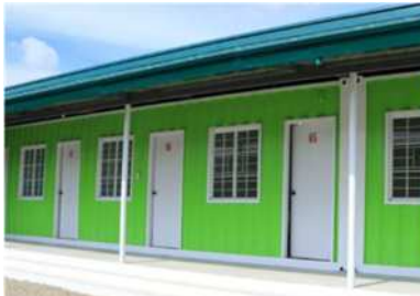
Isolation and Recovery Facility